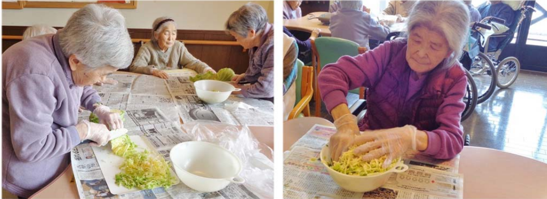
◇入所棟ご利用者の皆さま

日に日に暖かくなり、春が近づいてきた3月。当施設のあちらこちらから食欲をそそる香ばしい匂いが漂ってきました。居ても立ってもいられなくなった私、広報誌担当の高橋は、ビールを片手に屋台を放浪・・・いえ、カメラを片手にあちこちへ取材に行ってきました。入所棟では、「お好み焼き」と「たこ焼き」、デイケアでは「ホットケーキ」が作られていました。ご利用者の皆さまは、具材や生地の下ごしらえから焼く過程まで参加しておられました。