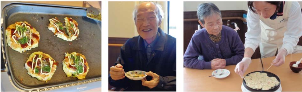
◇デイケアご利用の皆さま