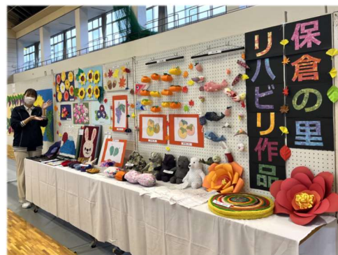
○手作りの小さな文化祭