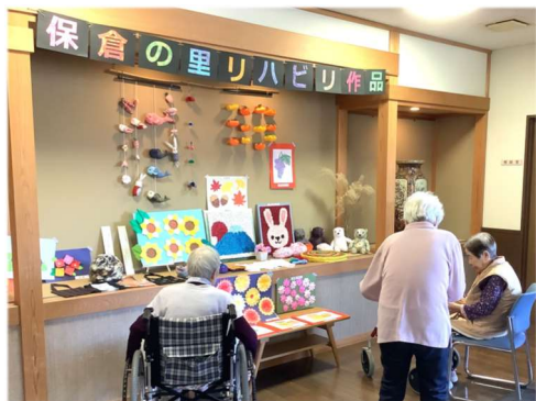
○囲炉裏ホールにて

ご利用者の皆様がリハビリの一環で制作された貼り絵や刺しゅう等の手芸作品を施設の囲炉裏ホール(正面玄関)に展示させていただきました。入所されている皆様をはじめ、ご家族の皆さま、来所された方々にご覧になっていただき、作品をご覧になった方からは「見事だねえ〜」「皆さん上手に作りますね〜」「立派な作品ですね」等の感想をいただきました。そして、10月下旬には浦川原体育館で開催された「手作りの小さな文化祭」にも出展させていただきました。